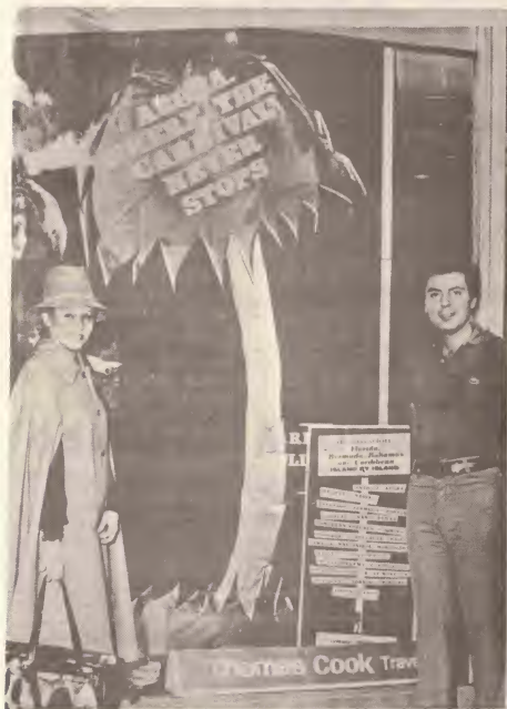
Mas promocion pa Aruba den exterior

Siendo cu turismo ta e pilar di nos economia, Gobierno Insular a haci tur esfuerzonan pa promove e industrie aki mas intensivamente.